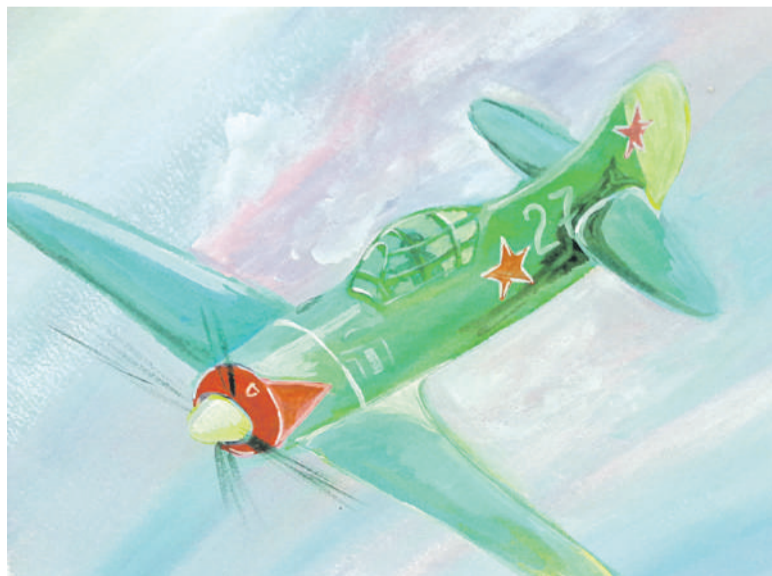
Воздушный бой. Рисунок Дмитрия Новикова (Корочанская школа им. Д. Кромского)