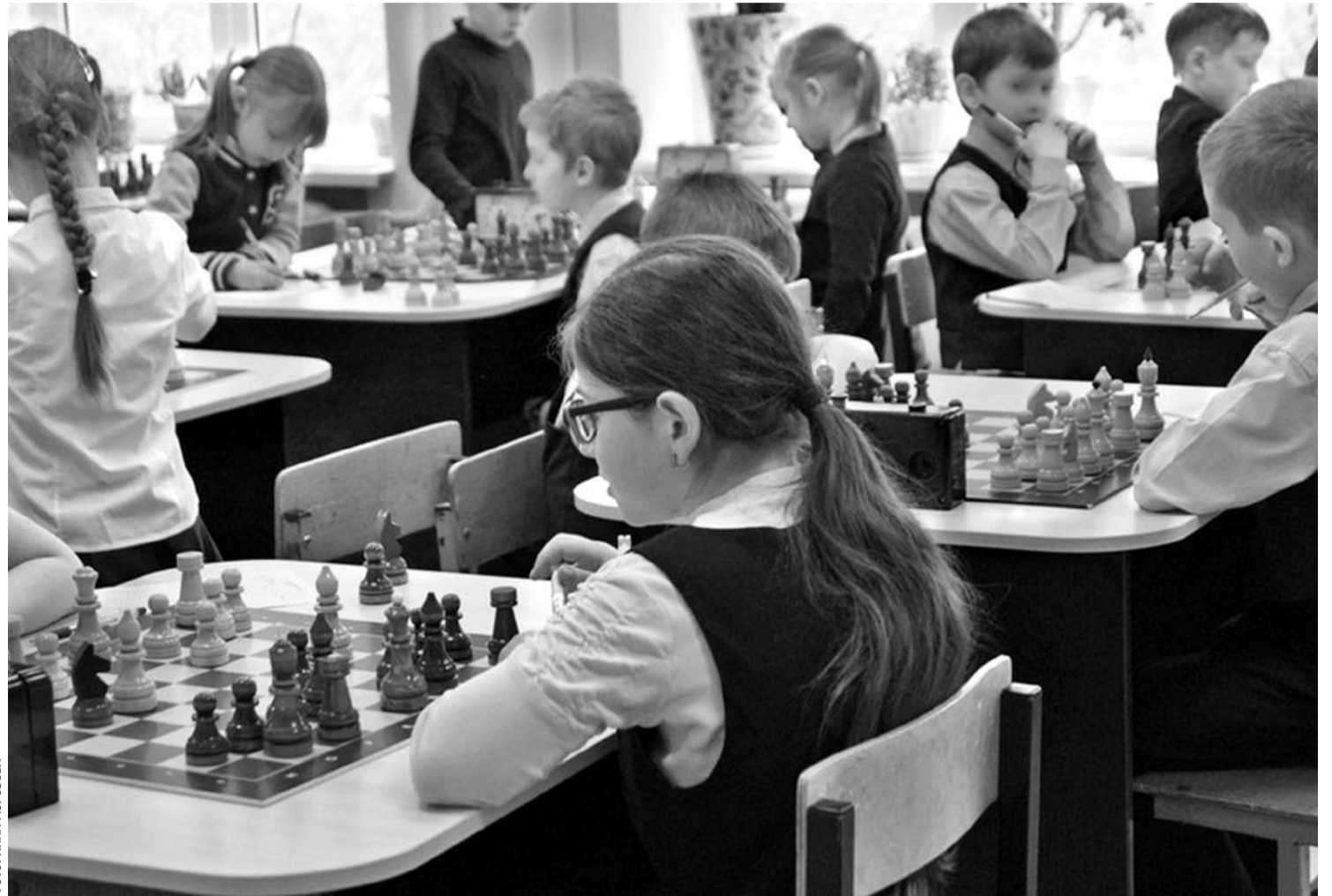
В образовательном комплексе «Луч»

— Высокий уровень локального нормотворчества. В этих учебных заведениях есть хорошо проработанные локальные нормативные акты, которые обеспечивают порядок. Основные образовательные программы и программы развития направлены на активное познание мира, развитие учебно-исследова-