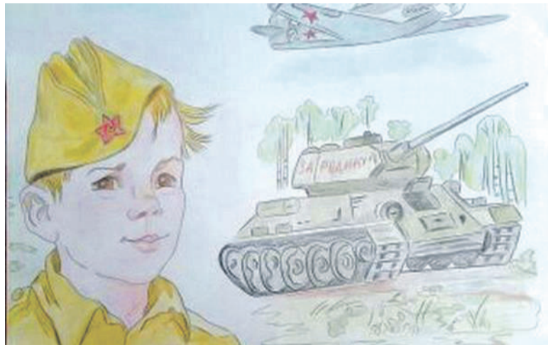
Рисунок Дарьи Лопиной (Корочанская школа им. Д. Кромского)