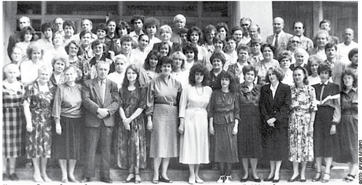
Коллектив Белгородского областного института усовершенствования учителей, 1994 год

Благодаря профессионализму, преданности своему делу, большому трудолюбию, таланту преподавателей, педагогов институт развивался, успешно выполняя свою главную миссию — повышать качество образования Белгородской области. Сегодня наш институт обладает высоким потенциалом, компетентным и работоспособным профессорско-преподавательским составом, который полон творческих планов и замыслов. Надеюсь, что всё это позволит нам эффективно реализовывать как региональные, так и федеральные инициативы. Желаю всем преподавателям и сотрудникам Белгородского института развития образования радости, профессиональных побед, счастья и любви близких, душевного равновесия, интересного и плодотворного учебного года!