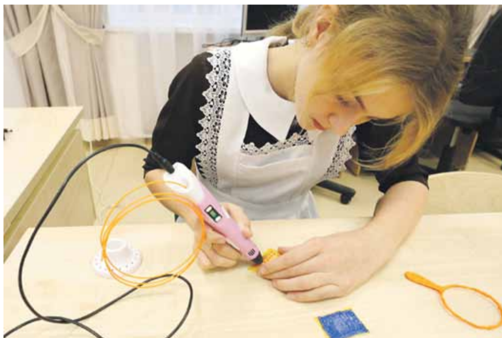
В Вязовской школе дети быстро освоили 3D-ручки