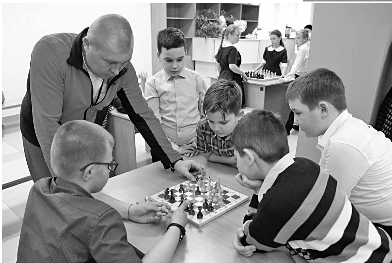
Шахматные перемены в Красноярской школе № 2