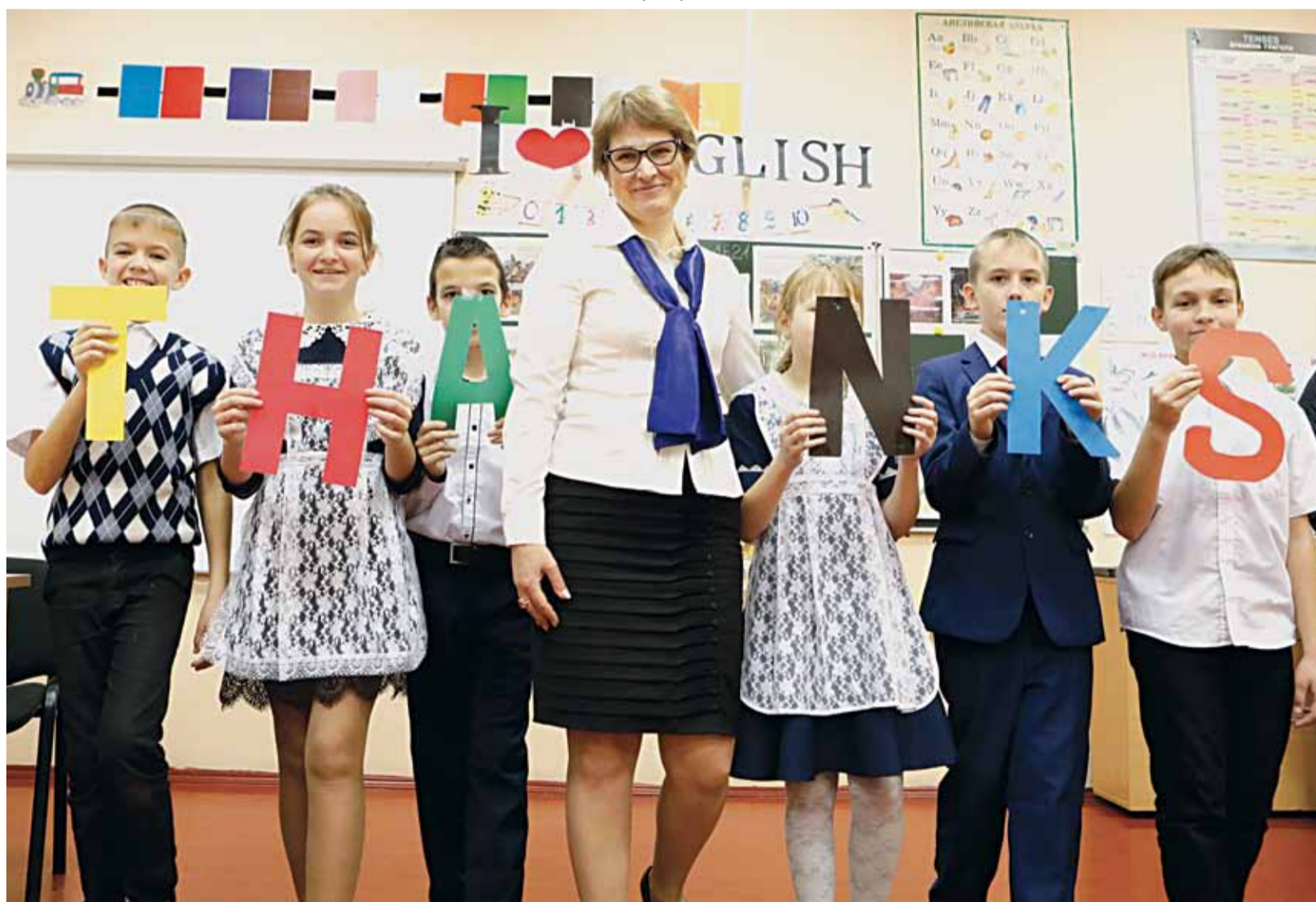
На дополнительных занятиях по английскому языку в Илёк-Пеньковской школе Краснояружского района

Школа полного дня — явление не новое для отечественной педагогической практики. Интерес к этой теме то утихает, то вновь возрастает. Новое осмысление она получила в связи с региональной стратегией «Доброжелательная школа», реализация которой рассчитана на 2019–2021 годы.