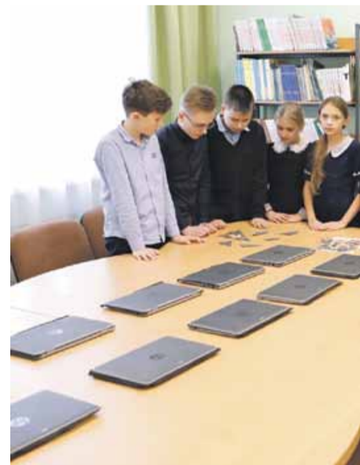
В библиотеке школы № 2