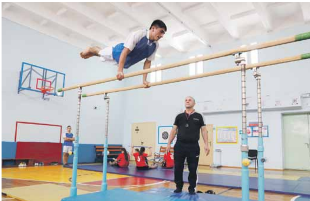
На внеурочных занятиях по спортивной подготовке в Степнянской школе