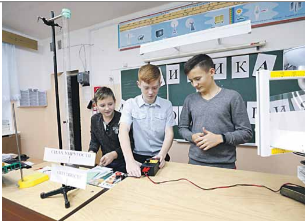
Занятия в кабинете физики. Школа № 1

А ещё школе повезло в том, что она построена единым комплексом с красноярским ФОКом. И школьники могут заниматься в его бассейнах, тренажёрных и спортивных залах. Мало того, по рекомендации врачей мальчишки и девчонки могут в ФОКе бесплатно пройти курс массажа!