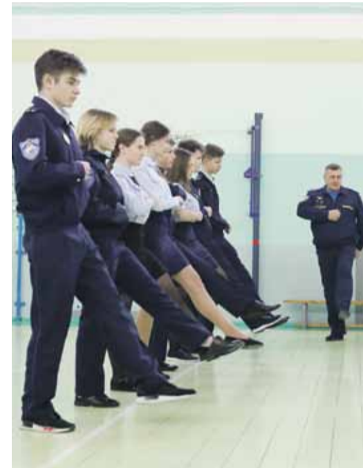
Строевая подготовка у кадетов в школе № 2