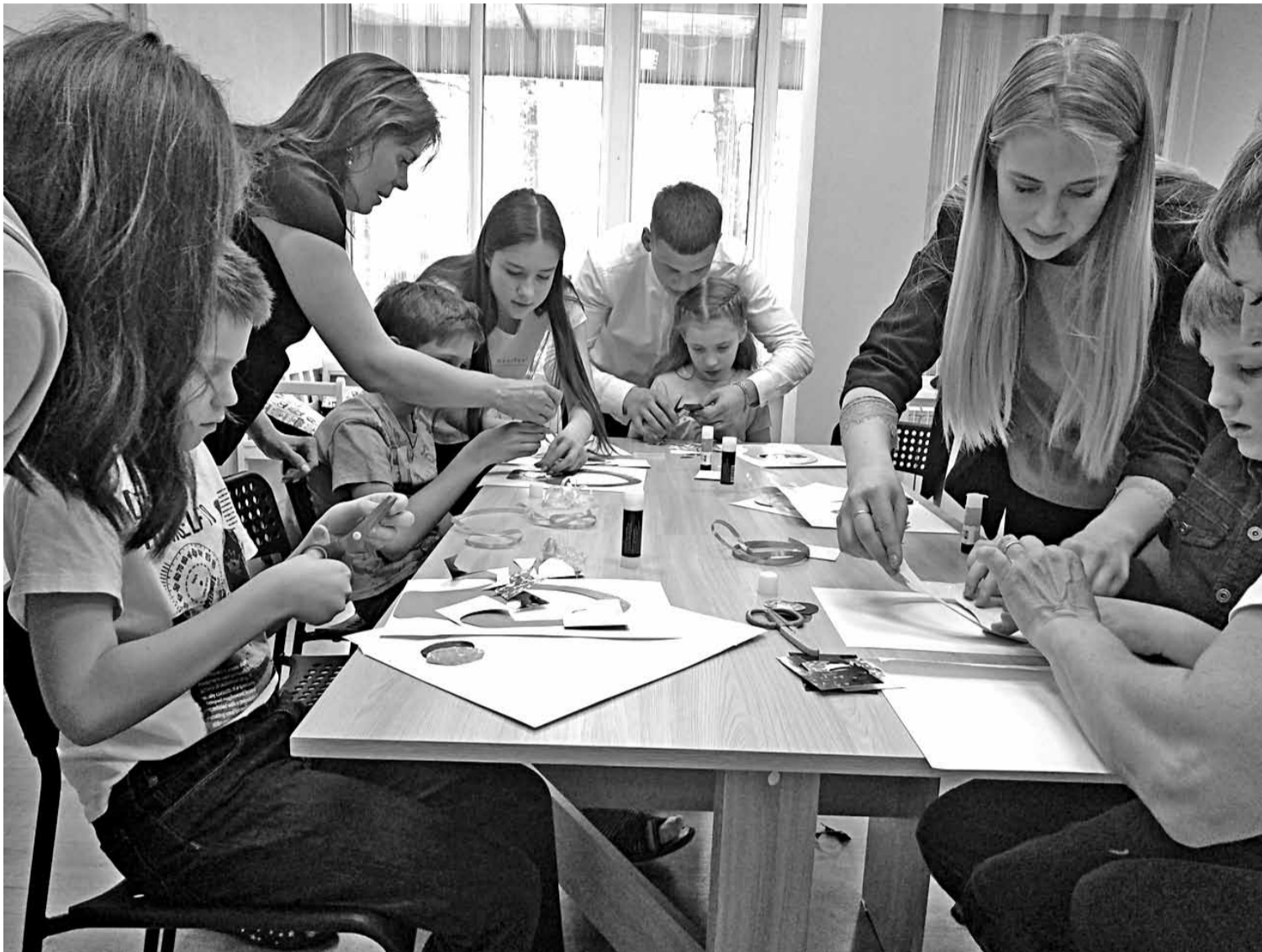
Воронежские волонтеры проводят занятия с подопечными «АутМамы»

ОБ ОПЫТЕ ВОРОНЕЖСКОЙ ОБЛАСТИ В РАБОТЕ С ДЕТЬМИ С РАС