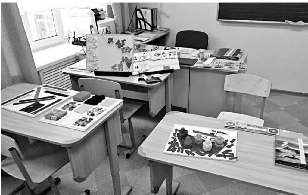
В творческой мастерской для детей с РАС

гружение работников в проблему, их изменившееся мышление и сознание. Специалисты не пытались создать видимость благополучия, а открыто говорили о трудностях, размышляли, рассказывали о поиске оптимальных методов и подходов.