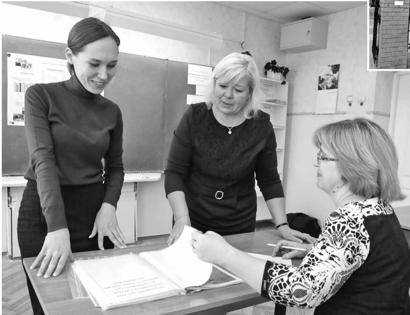
Работа с наставником