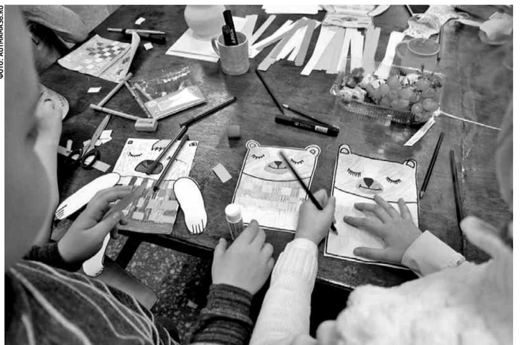
Мастерские для детей-аутистов в Воронеже

В работе с детьми с РАС в Воронеже активно применяют гончарное дело, для этого в школах создали гончарные мастерские. Через глину дети с РАС привывают друг к другу. Лепка развивает не только мелкую моторику, но и абстрактное мышление, которого у детей с РАС практически нет. В