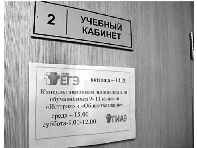
Консультационные площадки в Краснояружской школе № 2