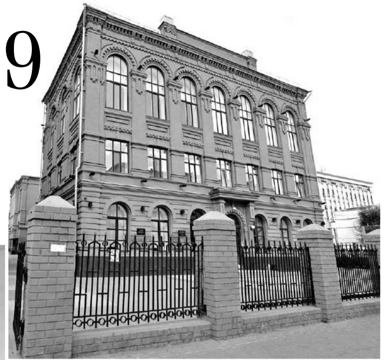
Лицей № 9

— Использование картирования позволило выявить проблемные места в образовательной деятельности и проанализировать возможности их устранения. Сейчас в лицее разработан 21 бережливый проект, шесть из которых уже реализованы.