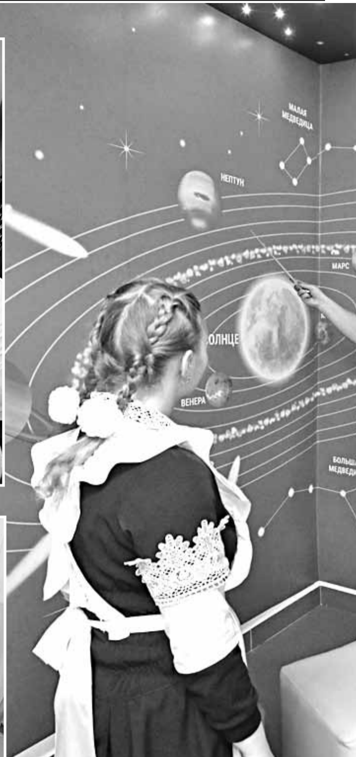
Астрономический уголок в Вязовской школе Красноярского района

Сегодня каждой школе законом разрешено самостоятельно осуществлять деятельность, разрабатывать и принимать локальные нормативные акты, содержащие нормы, регулирующие образовательные отношения. Отношение к принятию локальных нормативных актов должно меняться, оно должно быть заинтересованным со стороны не только педагогов, но и родителей. Не будем забывать, что родители — это равноправные участники образовательных отношений. Расписание — это такой же локальный нормативный акт. И если родители пренебрегли своим правом на участие в его обсуждении, а потом, когда расписание утвердили, стали упорно доказывать, что оно им не подходит, то это неправильно. Тем более что нелинейное расписание имеет право на существование. Главный довод в его пользу — это разнообразие занятий, а следовательно, условие сохранения здоровья и достижение необходимых результатов. Очень мудро поступили в Красноярской школе № 1, согласовав расписание с каждым родителем. Нужно уметь договариваться. Убеждён, что нет нерешаемых вопросов.