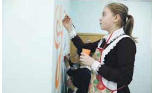
Ученики Степнянской школы сами разукрашивают стены