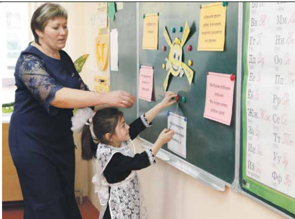
Урок в начальной школе села Степное