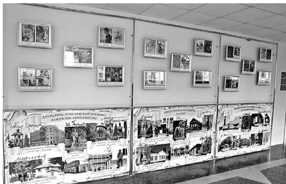
Образовательная зона лицейского литературного музея

На классных часах учителя рассказывают школьникам о способах применения бережливых инструментов на личном рабочем месте. Для