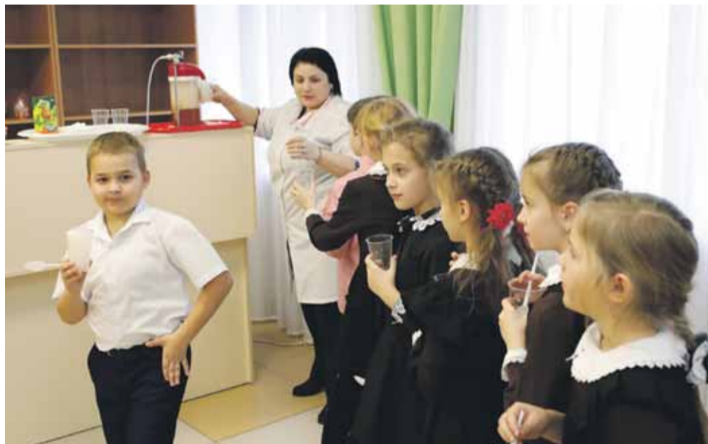
Каждый ученик школы № 2 за год проходит курс кислородных коктейлей

Школу села Степное часто называют многонациональной. Так сложилось, что в 90-е годы сюда переехали жить несколько десятков семей турок-месхетинцев. Люди здесь прижились, построили дома, родили детей, нашли работу... Но есть одно маленькое но: в большинстве семей до сих пор говорят на родном языке и в селе много детей, вынужденных знать два языка. Но в школе-то обучение ведётся на русском. И все экзамены нужно сдавать на русском языке.