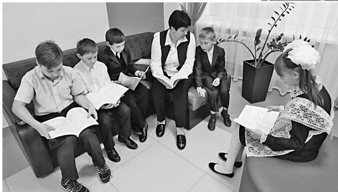
Зоны тихого отдыха в Вязовской школе Красноярского района