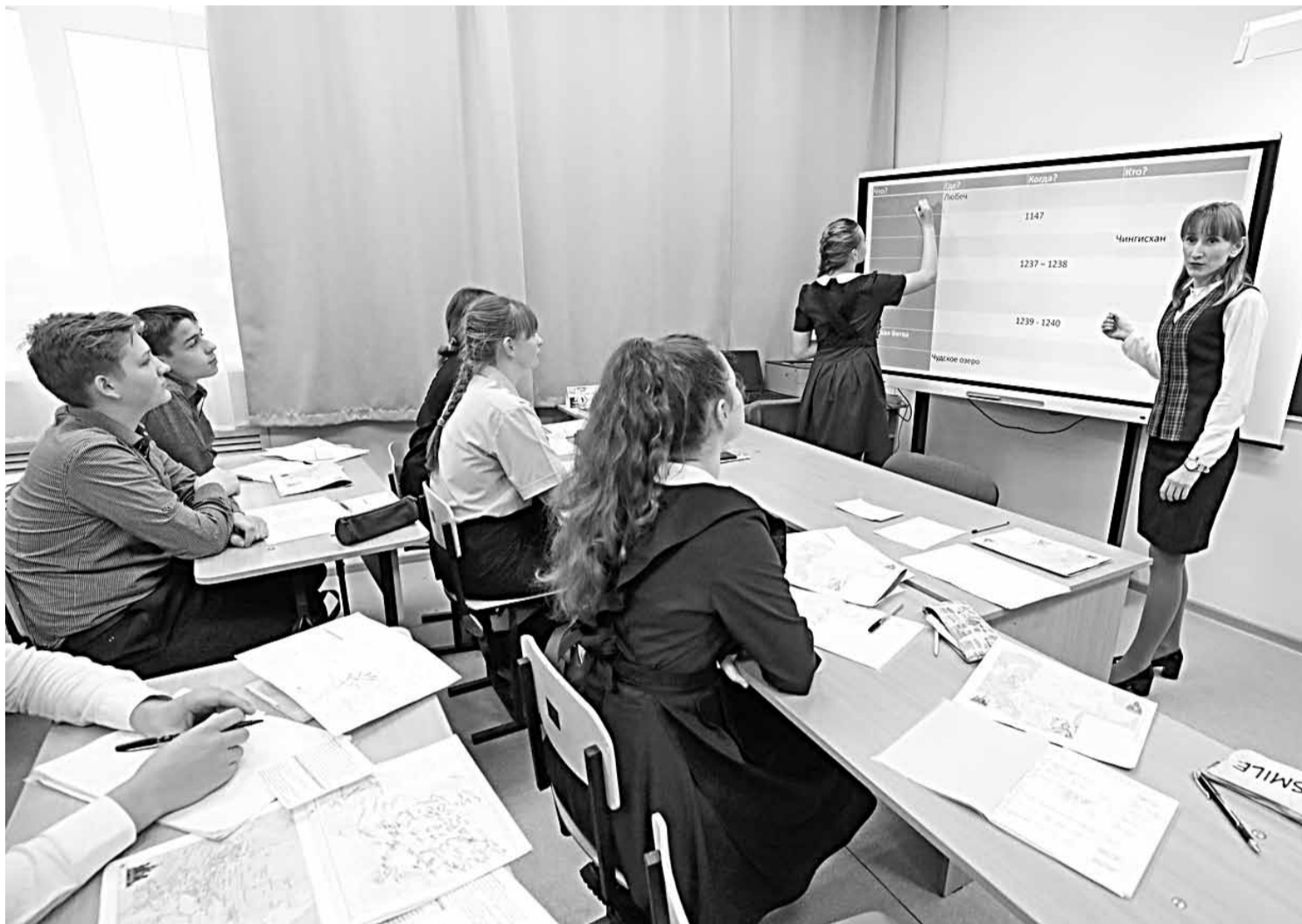
Несколько смарт-досок для школ района приобрели в рамках нацпроекта «Образование»

Почему только час? Потому что расписание очень насыщенное. И учебными делами детям нужно заниматься дозированно, иначе проку никакого не бу-