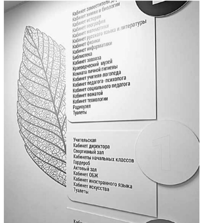
Элементы бережливых технологий в Краснояружской школе № 2