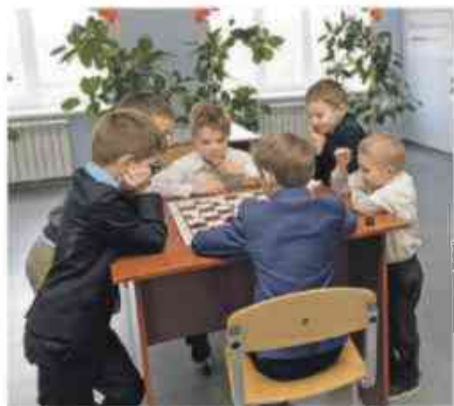
Шашечно-шахматная зона в Крюковской школе