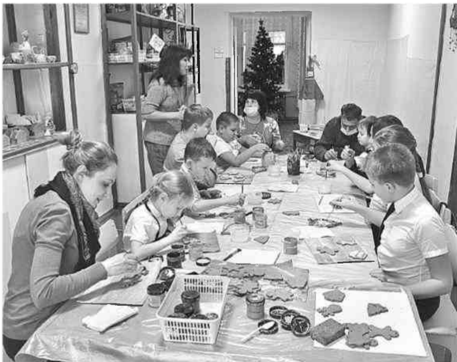
Занятие в гончарной мастерской «РАСпрекрасная керамика» в Губкинском центре внешкольной работы

На заключительный этап фестиваля было представлено 103 конкурсных видеоматериала по декоративно-прикладному, художественному и театральному творчеству, хореографии, вокалу, свободному творчеству. Члены жюри отметили высокий уровень исполнительского мастерства, творческий подход, разноплановый репертуар участников. Всех детей наградили дипломами, медалями, книгами.