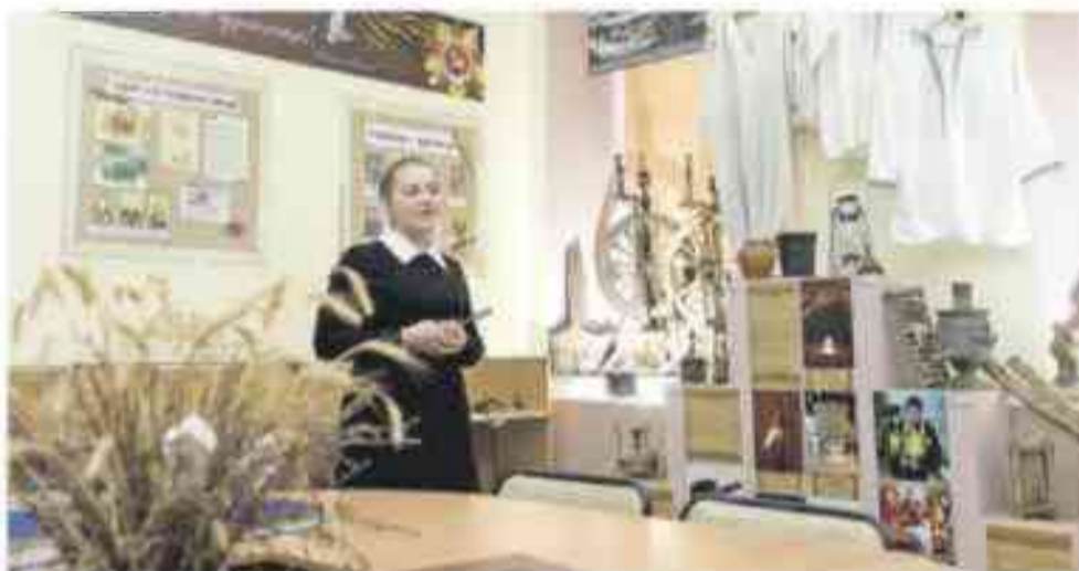
Историко-краеведческий музей Борисовской школы № 1 имени А.М. Рудого насчитывает 685 единиц хранения

логорья». Как и полагается, юные корреспонденты «приправили» запись хештегами: #БорисовскаяСОШ #газета_доброжелательная_школа #ДШ. Ведут также «Инстаграм» и совсем недавно создали Ютуб-канал. С контентом проблем нет. Школьники то и дело отличаются на районных, областных и всероссийских конкурсах и соревнованиях. Взять хотя бы школьную