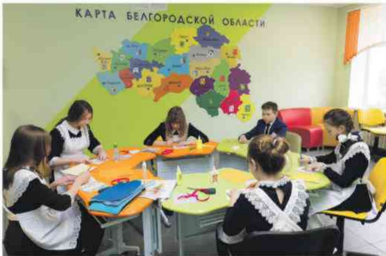
В коворкинг-зоне Крюковской школы ребята из изостудии делают пасхальную открытку