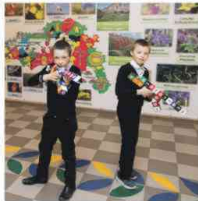
Игровая подвижная зона — любимое место учеников начальных классов Хотмыжской школы