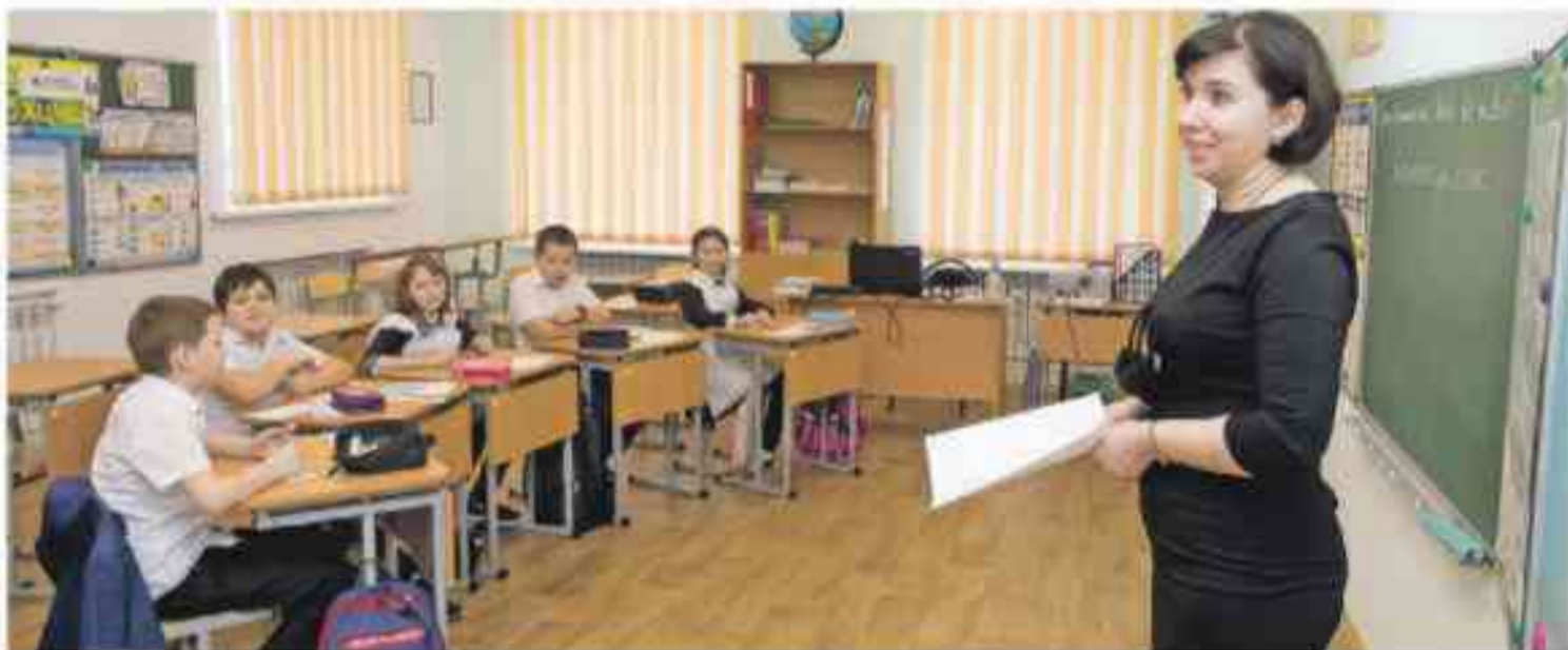
Классы Борисовской начальной школы им. Кирова маленькие — по 5–6 человек, так что можно поэкспериментировать с расстановкой парт, к примеру, поставить их полукругом

В школе есть телестудия «Репортёр» и уже 21-й год подряд неизменно раз в месяц выпускается газета «Мир детства». Кстати, в ближайшее время планируют выкладывать в открытый доступ электронную версию. С оперативностью ребята на «ты». Не успели мы посмотреть хореографический класс, мини-актовый зал, литературную гостиную, как на школьной страничке в соцсети «ВКонтакте» уже красовалось: «Сегодня в стенах нашей школы мы встречаем корреспондентов газеты «Доброжелательная школа Бе-