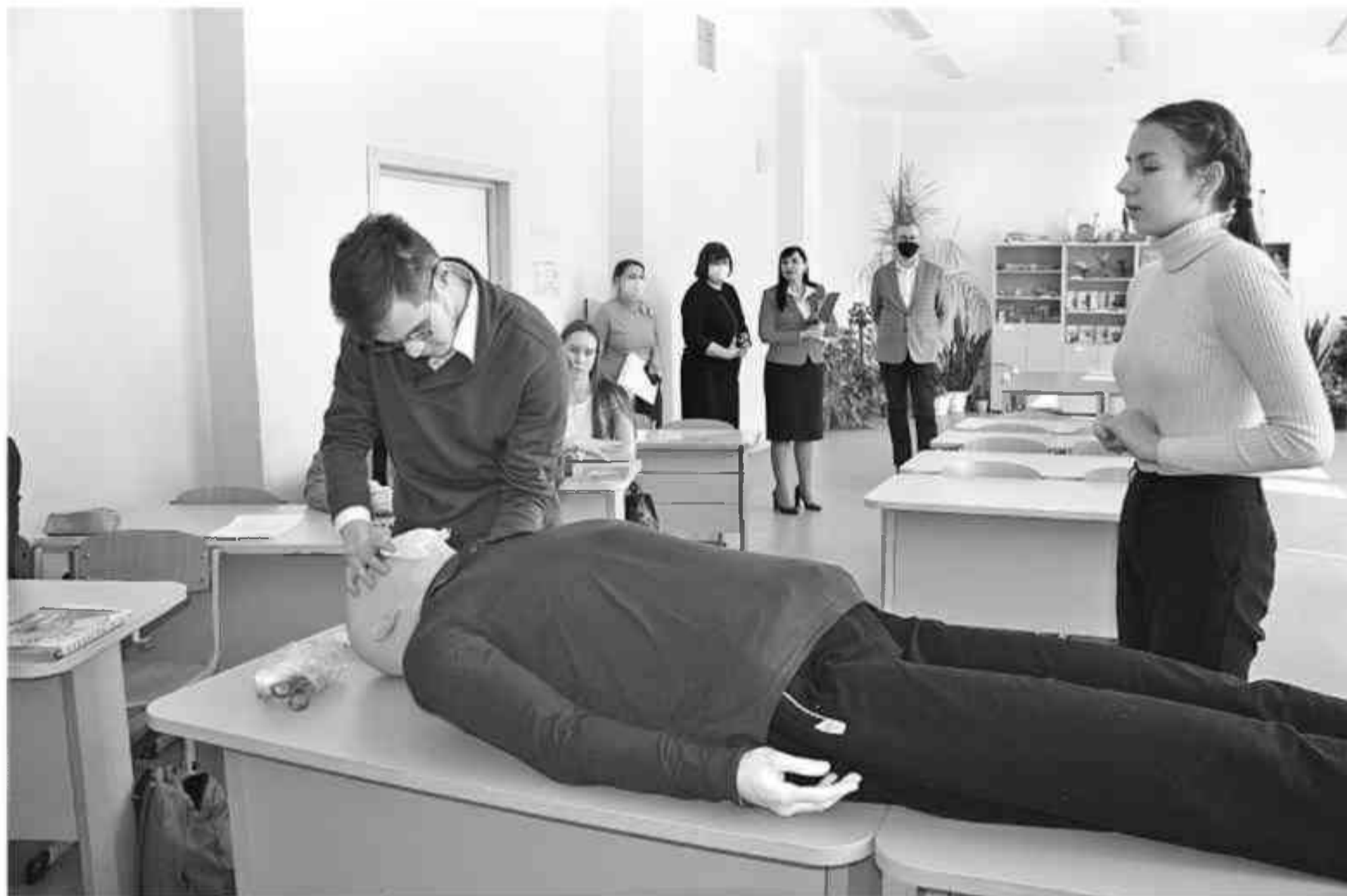
Урок биологии в медицинском классе Центра образования № 15 «Луч»

ПОЧЕМУ СЕЙЧАС В ШКОЛАХ НЕДОСТАТОЧНО ПРОСТО ПРОФИЛЬНОГО ОБУЧЕНИЯ