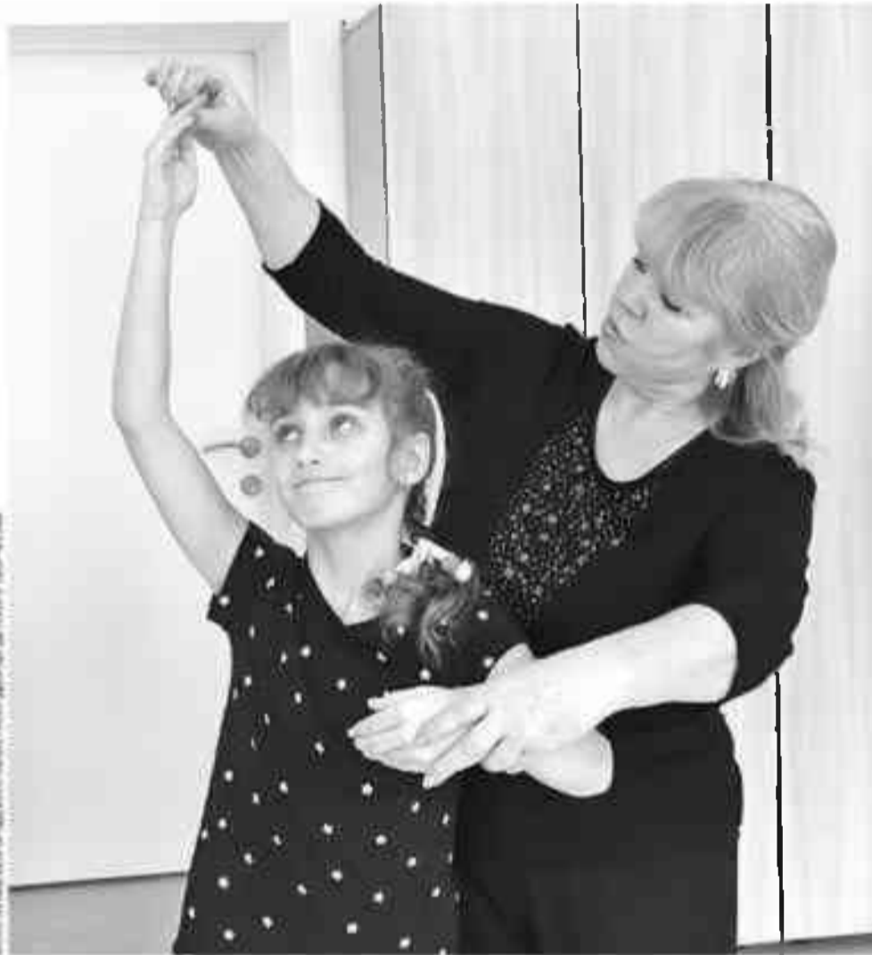
Занятия в хореографической студии для детей с РАС Белгородского областного дворца детского творчества

— Конечно. Мы провели мониторинг кадрового потенциала, педагогические работники проходят курсы и обучающие семинары на базе федеральных и региональных организаций высшего образования. В 2020 году обучили 91 педагога, 21 из них прошёл дистанционное обучение в Московском государственном психолого-педагогическом университете. Четыре педагога прошли дистанционные курсы повышения квалификации в институте коррекционной педагогики Российской академии образования по теме