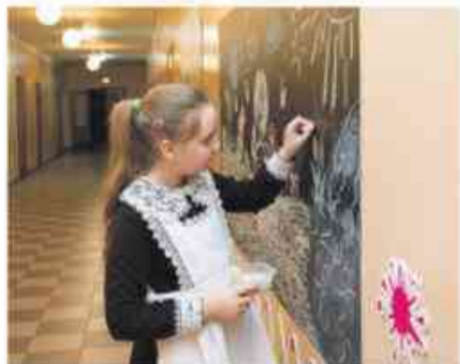
Ученики начальных классов Хотмыжской школы обожают рисовать мелками на досках в рекреации

КАК В БОРИСОВСКИХ СЕЛЬСКИХ ШКОЛАХ ИДУТ В НОГУ СО ВРЕМЕНЕМ