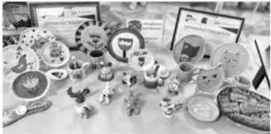
Работы учащихся гончарной мастерской «РАСпрекрасная керамика» Центра внешкольной работы г. Губкина

Первая ресурсная группа открылась в 2017–2018 учебном году в детском саду № 29 «Золушка». В текущем году ресурсные группы функционируют уже в трёх детских садах. Образование получают 15 детей.