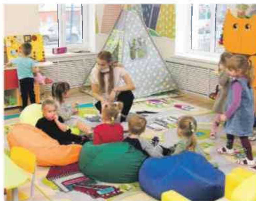
Игровая комната детсадовцев ясельной группы при Борисовской начальной школе им. Кирова