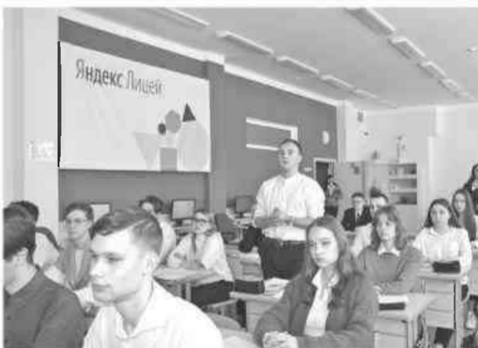
Урок информатики в IT-классе Центра образования № 15 «Луч»