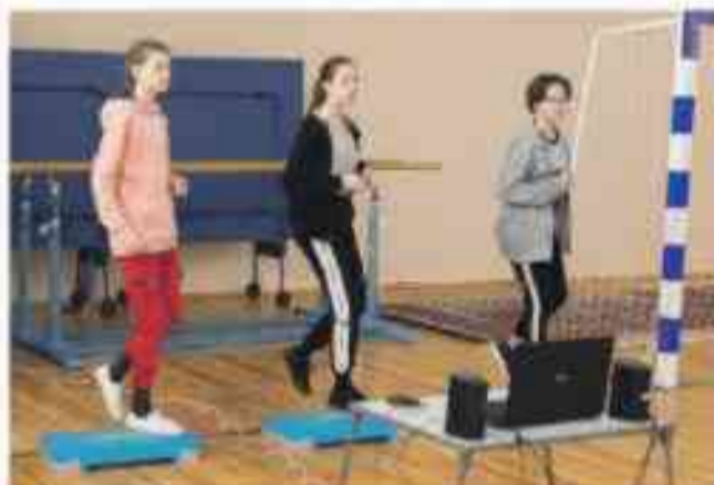
Для старшеклассников Хотмыжской школы на физкультуре и внеурочке проводят занятия по степ-аэробике