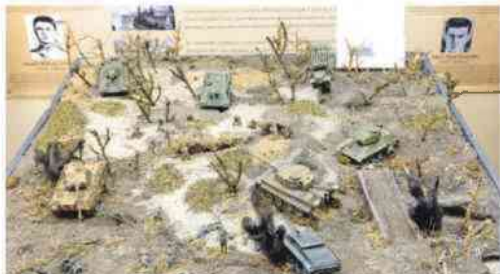
Макет «Танковая дуэль»